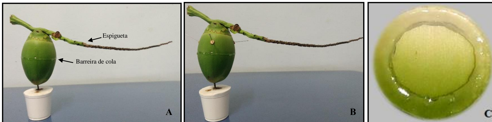
Figura 1. (A) Unidade experimental utilizada no experimento de efeito de pistas sobre a infestação de frutos por A. guerreronis . (B) Unidade experimental utilizada no experimento de efeito de pistas sobre a infestação de frutos infestados por A. guerreronis . (C) Unidade experimental utilizada no experimento de efeito de pistas sobre o caminhamento de A. guerreronis .